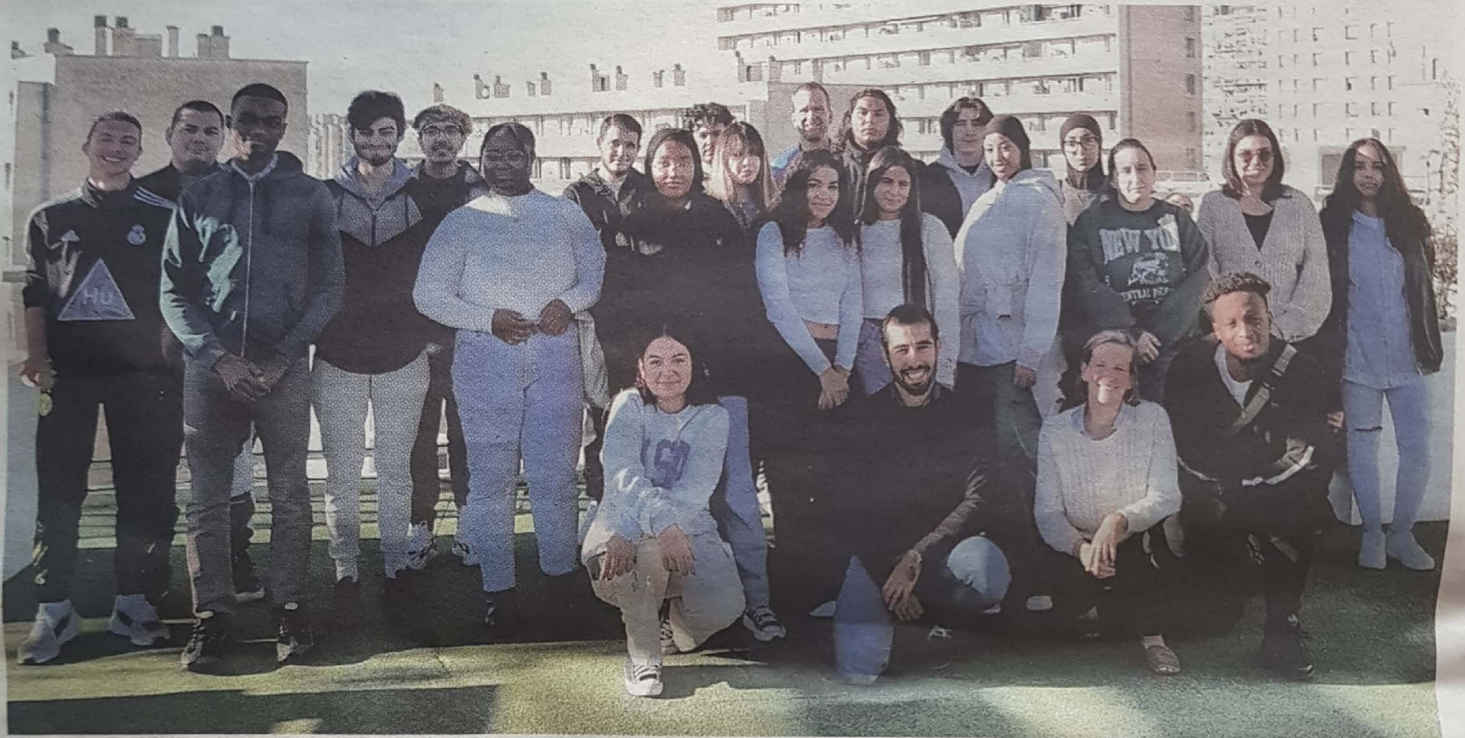
La promotion 2023 d'Evocae sur le toit de l'EMD, à Marseille.

Marseille abrite deux dispositifs innovants pour les naufragés de Parcoursup.